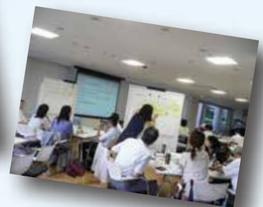
前回2011年9月の人権ワークショップの様子